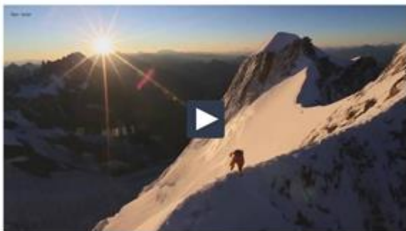
82 Viertausender in zwei Monaten: Die erfolgreichsten Momente des Tempo-Alpinisten Ueli Steck.

Ueli Steck war mehr als ein Bergsteiger – ein Forscher im Grenzbereich zwischen Leben und Tod. Ein Nachruf.