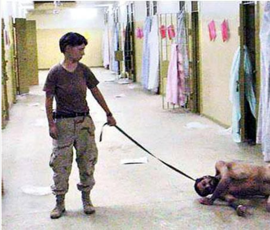
Lynndie England, fotografiert von Soldatenkollegen